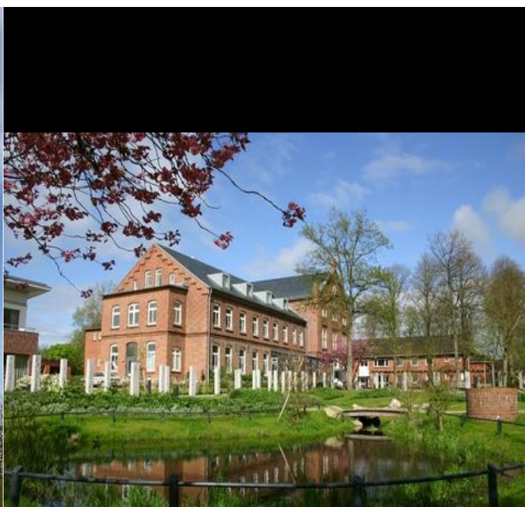
Christian Jensen Kollegiet, Breklum