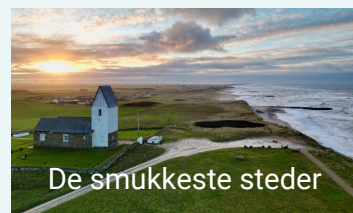
De smukkeste steder