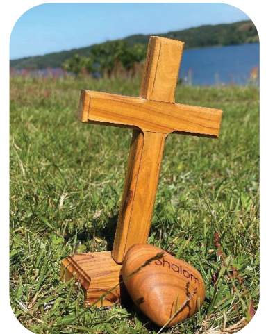
Kors og hjerte i oliventræ – fra Pilgrimsmesse udendørs ved Hald sø

En række af udvalgets aktiviteter i 2024 beskrives særligt nedenfor: