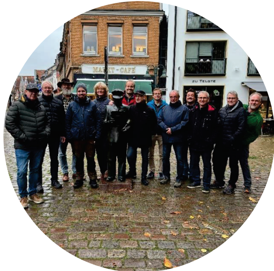
Pilgrimspræsten deltager i møde med det tyske pilgrimsnetværk i Telgte, Tyskland

Pilgrimspræsten er med i bestyrelsen for den nationale pilgrimsparaply Pilgrim Danmark og han har i flere sammenhænge kontakt til pilgrimme og pilgrimsinteresserede i såvel indland som udland.