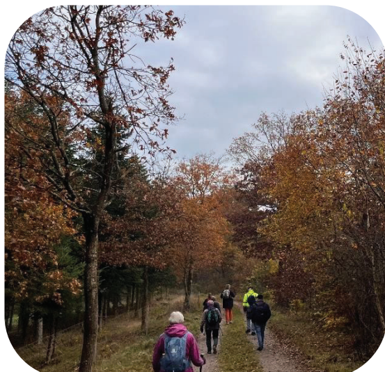
Klima-vandring på Kalk Kaminoen

Udvalget arrangerer i løbet af året en række dagsvandringer, hvor det er muligt at få en erfaring af at vandre som pilgrim. Flere deltagere er erfarne pilgrimme, som tidligere har gået længere vandringer fx på Caminoen i Spanien. Andre går med uden nogen erfaring med at "gå som pilgrim". De fleste deltagere er glade for fællesskabet undervejs. Når man er undervej, kommer man let i snak med folk man ikke kendte. Vandringerne finder sted ud over året flere steder i stiftet. Nogle vandringer knyttes til særlige årstider eller temaer. Bl.a. blev der i oktober arrangeret en klimavandring med fokus på "være-dygtighed" og "bæredygtighed", hvor der til den afsluttende kaffe blev solgt bæredygtig chokolade og tøj fra en genbrugsbutik.