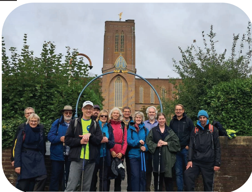
Deltager fra Danmark og England ved Guildford Cathedral

Læs desuden beskrivelse af opholdet "Dybt rodfæstet, fuldstændig åben", af Merete Rødkær Sørensen.