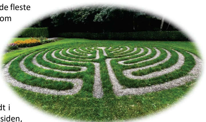
Labyrint på Lundeberg kirkegård, Fyn

Pilgrimsudvalget fortsætter det nuværende arbejde på de fleste områder. Udvalget har en interesse i at udbrede viden om "labyrinten", som fx kan anlægges på kirkegårde. I 2025 anlægges en Labyrint på Otting kirkegård, Salling provsti. Udvalget ønsker også at ruste andre til at lave vandringer. Derfor arrangeres en inspirationsdag i september 2025, hvor interesserede kan lære om pilgrimsvandring og få praktisk hjælp til selv at lave pilgrimsvandringer. Udvalget fortsætter med at lave aktiviteter som afholdt i 2024. Derudover påtænkes en opgradering af hjemmesiden, hvor der bl.a. kommer et årshjul med beskrivelse af udvalgets normale aktiviteter samt en liste over foredrag, som man kan hyre udvalget til, så pilgrimstankerne kan blive spredt endnu længere ud i Viborg Stift