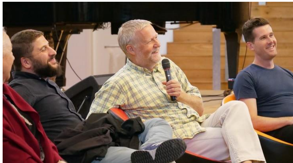
Paneldebat på Ikast-Brande Gymnasium