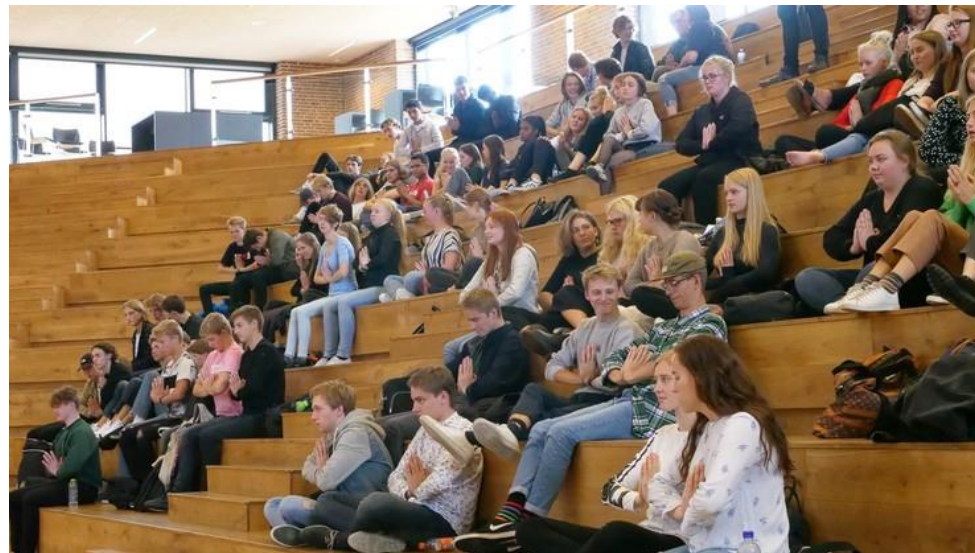
Religionsmøde på Ikast-Brande Gymnasium