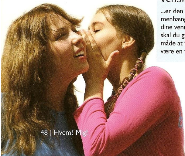
48 | Hvem? Mig!

Ærlighed: At være ærlig over for sine venner er meget vigtigt. Hvis man ikke stoler på dem, hvem skal man så stole på? På den anden side kan det godt være lidt anstrengende med folk, der synes, at de hele tiden har ret til at sige, hvad de vil. Hvad er bedst: at vennerne er ærlige og siger, at din nye trøje er kikset, eller at de laver en hvid løgn og siger, at den er helt okay?